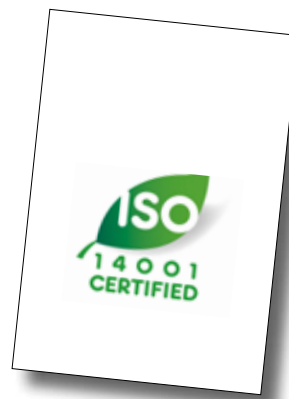
Ballingslövs miljøpolicy er ledestjernen i miljøstyringsarbeidet ifølge ISO 14001.

Ballingslövs miljøarbeid drives av en aktiv bedriftsledelse og engasjerte medarbeidere. Ved å sette opp tydelige målsettinger, motivere, informere, utdanne og følge opp kan vi sørge for at alle bidrar på beste måte.